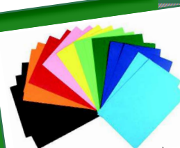
feuilles de couleur (100 ou 120 g/m 2 )