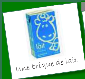
une brique de lait