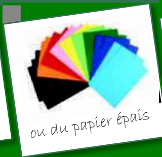
ou du papier épais